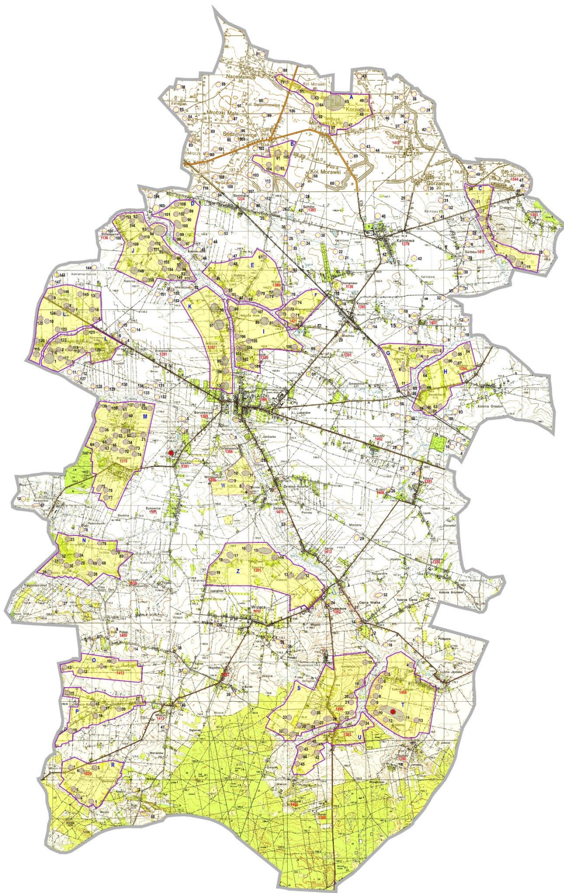
Ryc. 8. Gmina ewidencja stanowisk archeologicznych