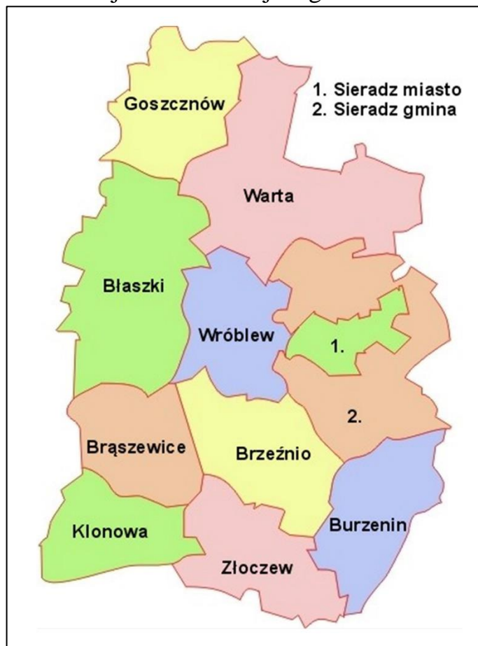
Ryc. 1. Gmina Błaszki w powiecie sieradzkim

Gmina Błaszki posiada stosunkowo dobrze rozwiniętą infrastrukturę komunikacyjną z drogami wojewódzkimi nr 449 relacji Błaszki – Syców i nr 710 przebiegająca od Łodzi przez Szadek, Wartę do Błazek i dalej do Poznania oraz drogą krajową DK12 2 . Pozostałe miejscowości połączone są ze sobą trzynastoma drogami powiatowymi. Należy przy tym podkreślić, że na północ od Błazek przebiega fragment kolejowej linii komunikacyjną o zasięgu lokalnym jak i międzynarodowym ze stacjami