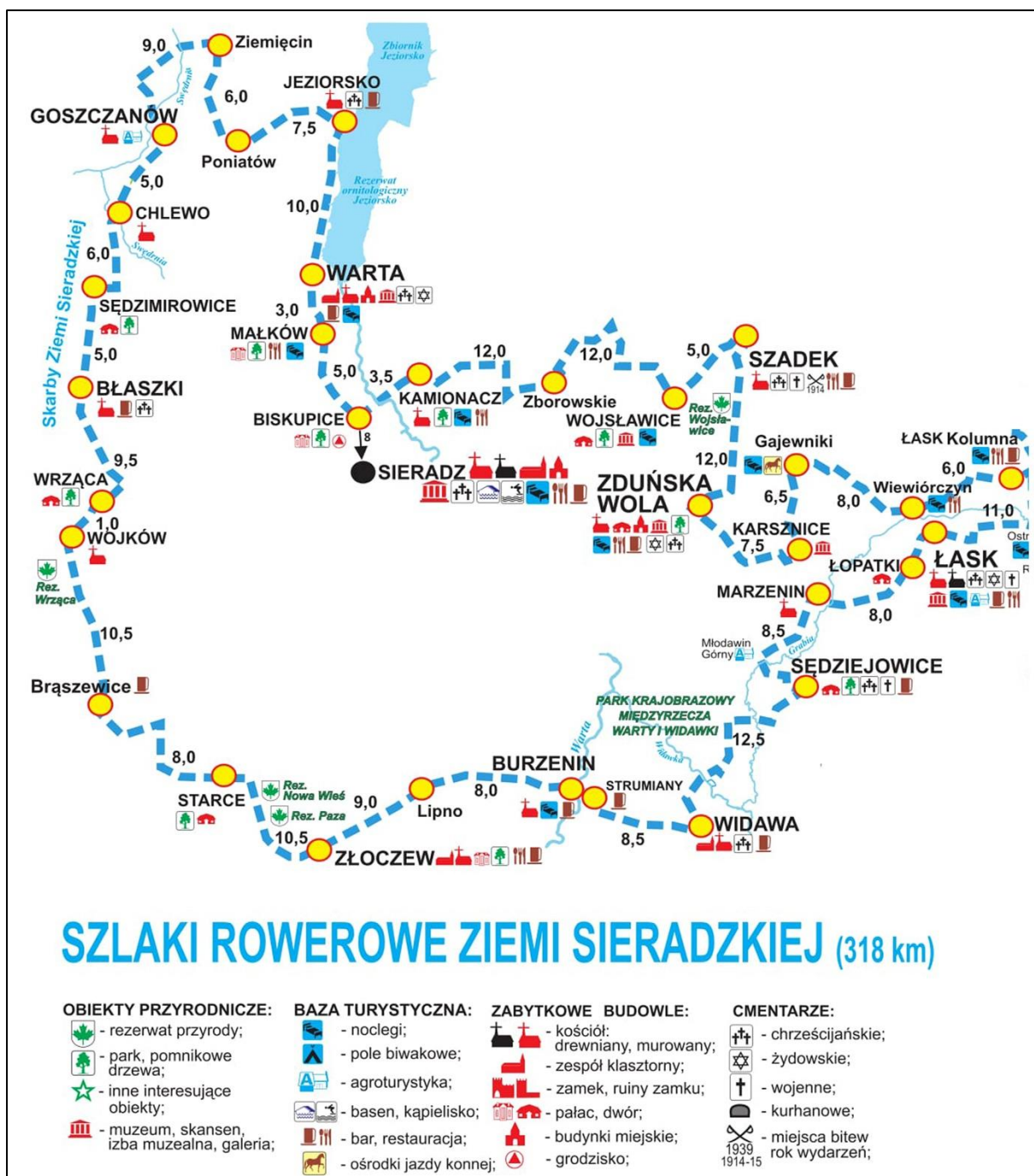
Ryc. 6. Szlaki rowerowe ziemi sieradzkiej