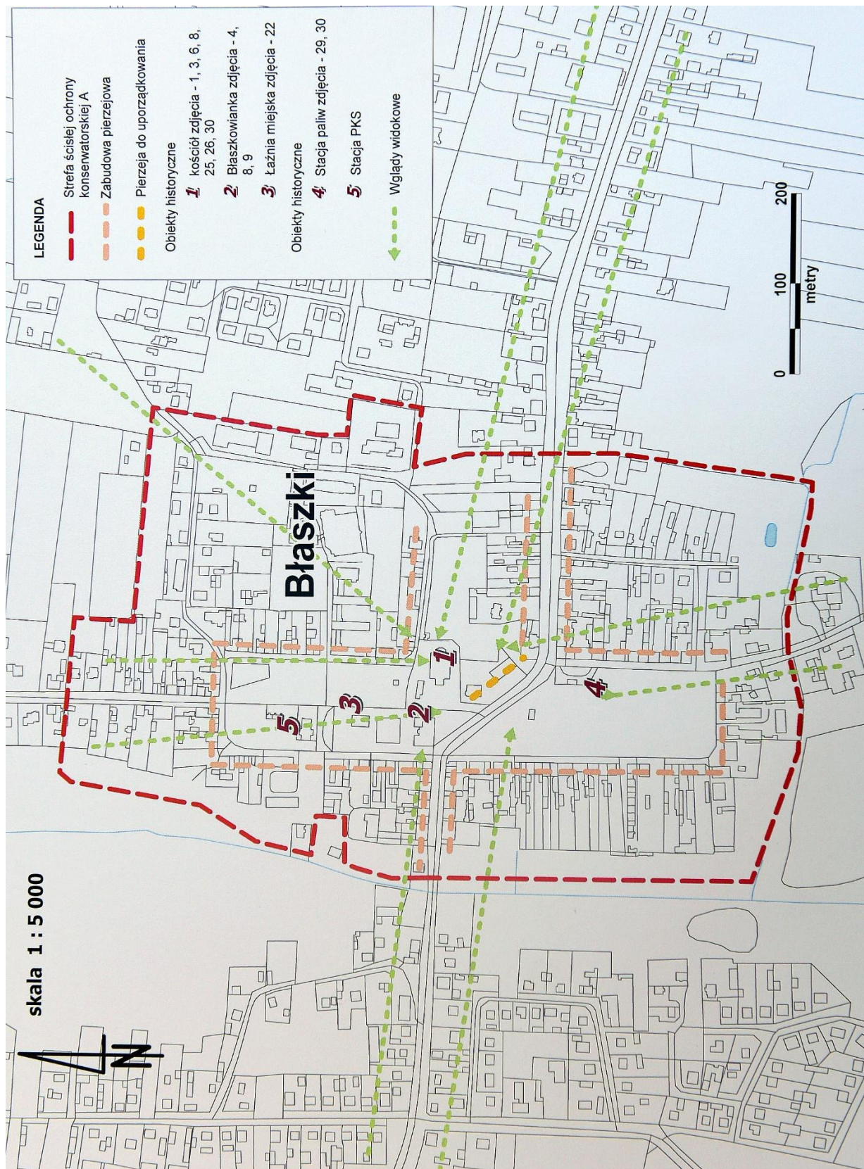
Ryc. 7. Błaszki - układ urbanistyczny