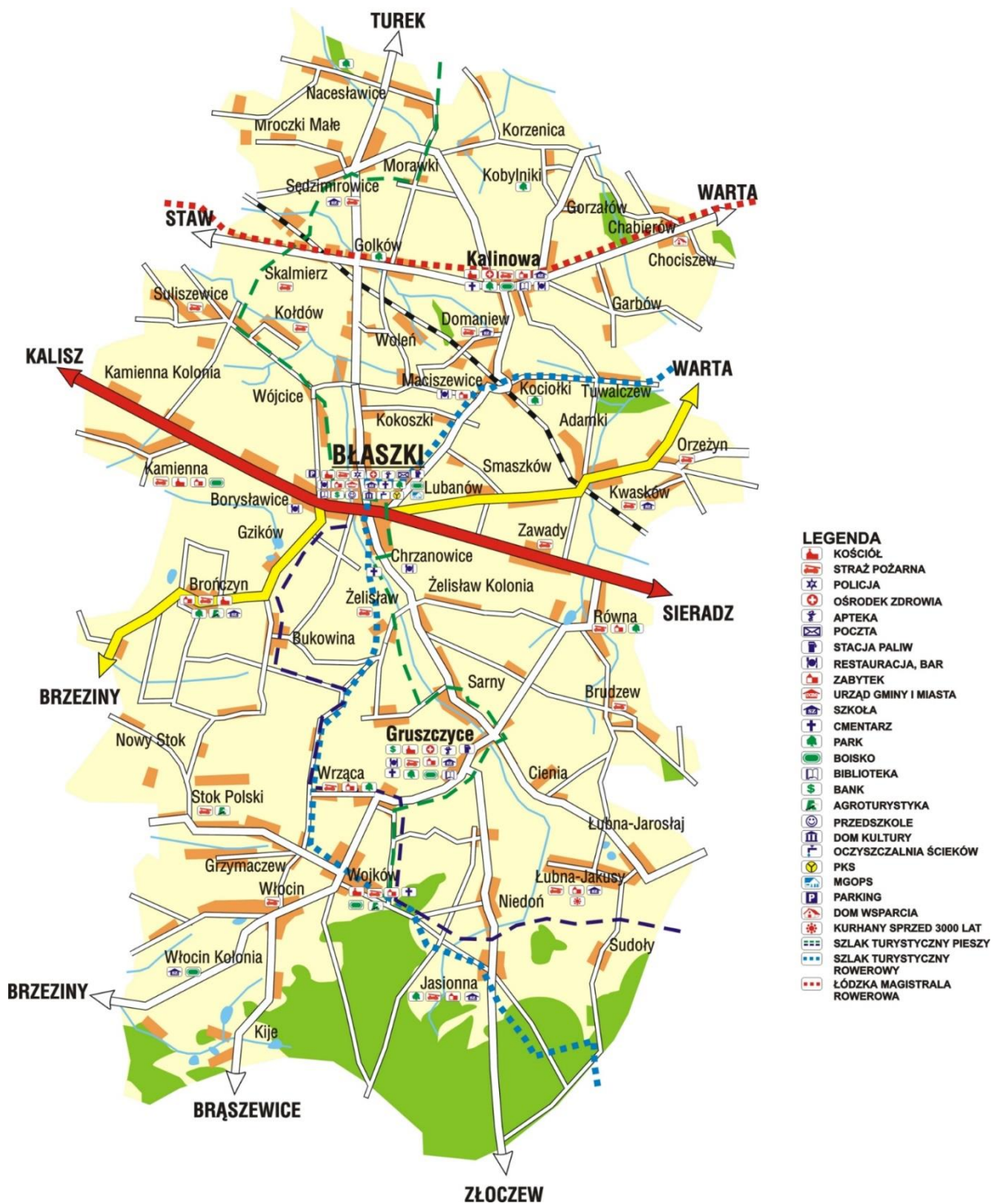
Ryc. 2. Gmina Błaszki - mapa topograficzna

kolejowymi w Błaszczach (Maciszewicach) i Skalmierzu.